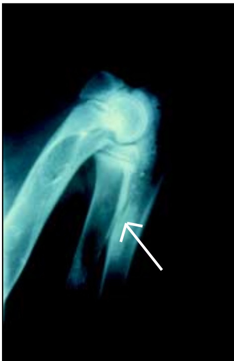
Figur 1 (til venstre): Røntgenbilde i sideplan av underarmsknokkel av hund med enostose.

Pilen viser et gråhvitt område inne i knokkelen som er typisk for tilstanden.