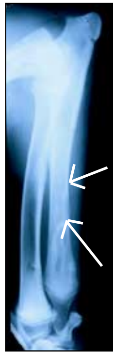
Figur 2 (til høyre): Røntgenbilde i sideplan av underarmsknokkel. Pilene markerer forstyrrelser i vekstområdene.

Pilen viser et gråhvitt område inne i knokkelen som er typisk for tilstanden.